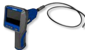
Inspektionskamera Art. nr. 19011-0106