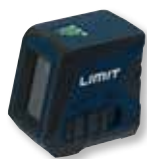
Korslaser grön Art. nr. 27746-0200