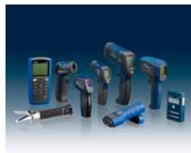
KLIMAT- & MILJÖINSTRUMENT