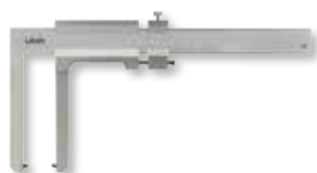
Skjutmått för bromsskivor Art. nr. 10910-0107